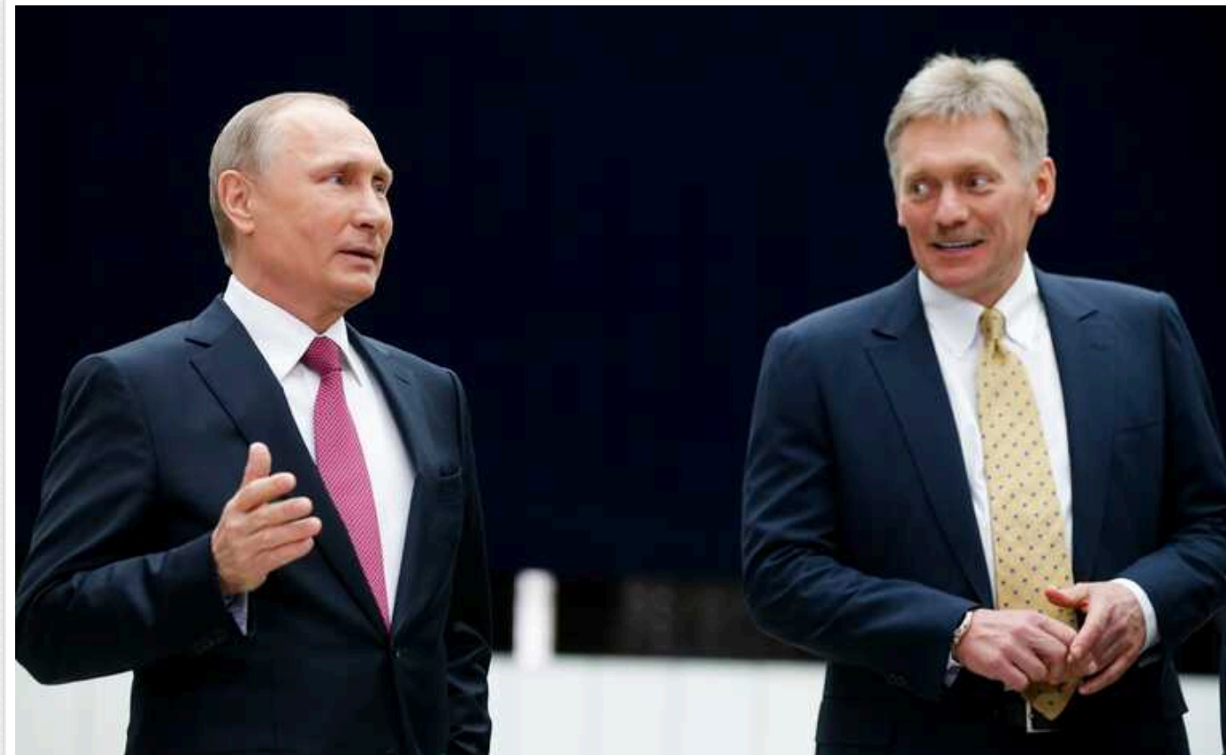
У Путіна заявили, що Росія перебуває у стані війни і не може допустити існування України

Після "виборів президента" в Росії заявили, що держава-агресор "перебуває у стані війни". Відмову від офіційної риторики про нібито проведення на території України "спеціальної військової операції" у Кремлі обґрунтовують необхідністю "внутрішньої мобілізації" кожного жителя Росії.