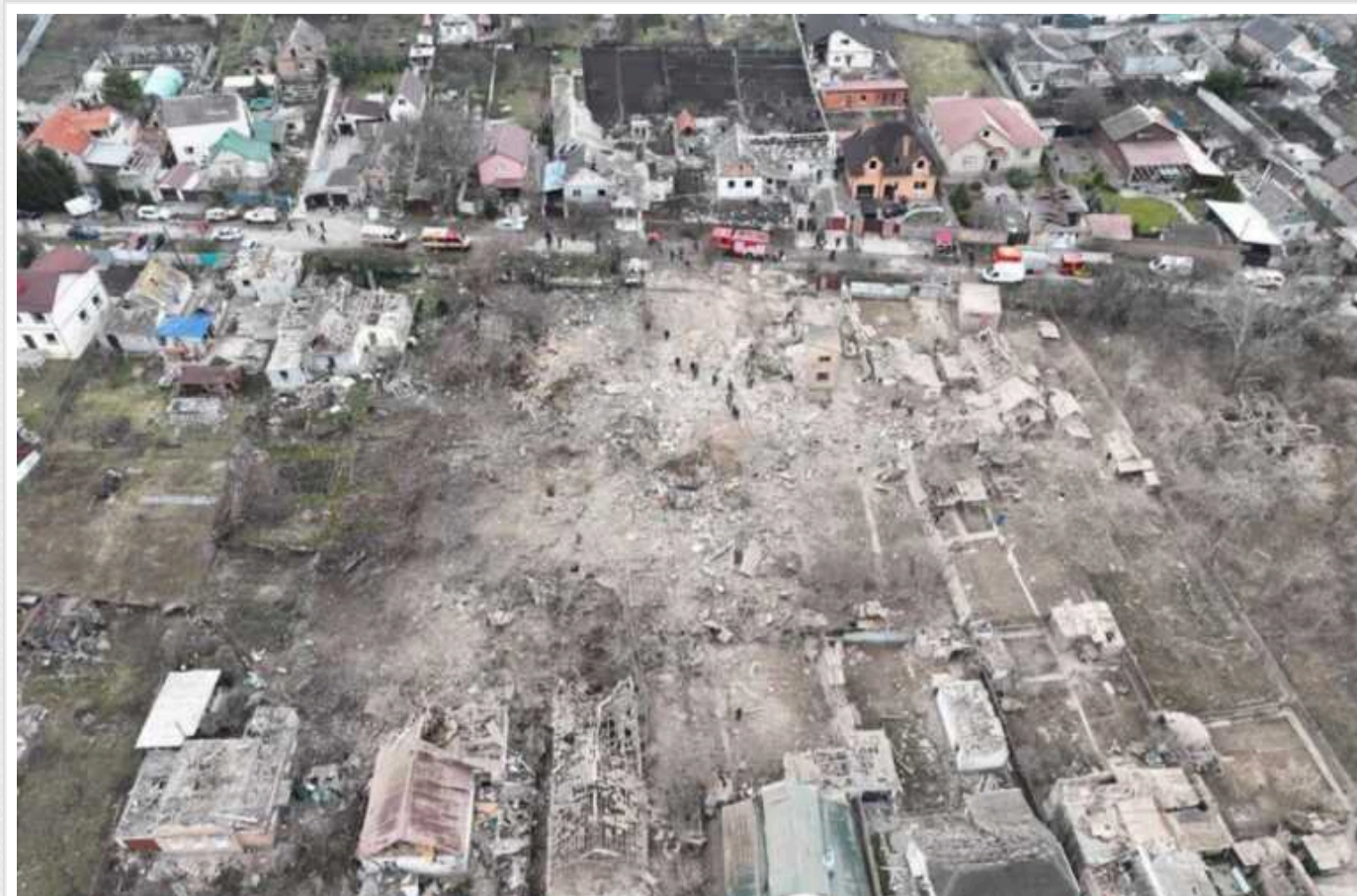
У Запоріжжі вже троє загиблих після прильотів, – ОВА

У Запоріжжі кількість жертв масштабної ракетної атаки на місто збільшилася до трьох осіб.