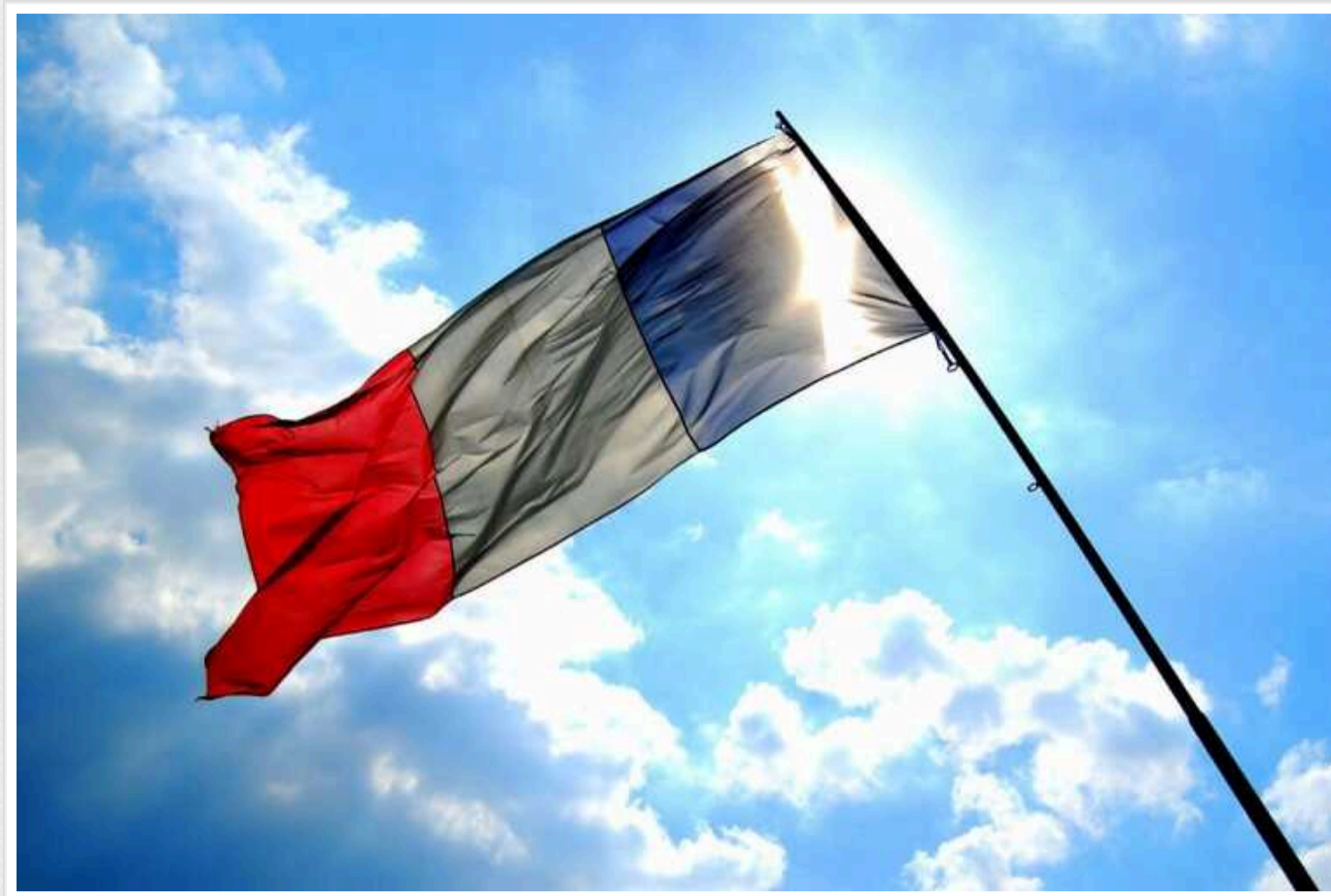
Франція готова інвестувати у виробництво озброєння в Україні

Посол Франції в Україні Гаель Вєсьєр заявив, що Париж готовий інвестувати у виробництво озброєння на території України. Країна вже збільшила свої витрати на оборону до 2% ВВП і частину цих коштів буде інвестовано у виробництво зброї в нашій країні.