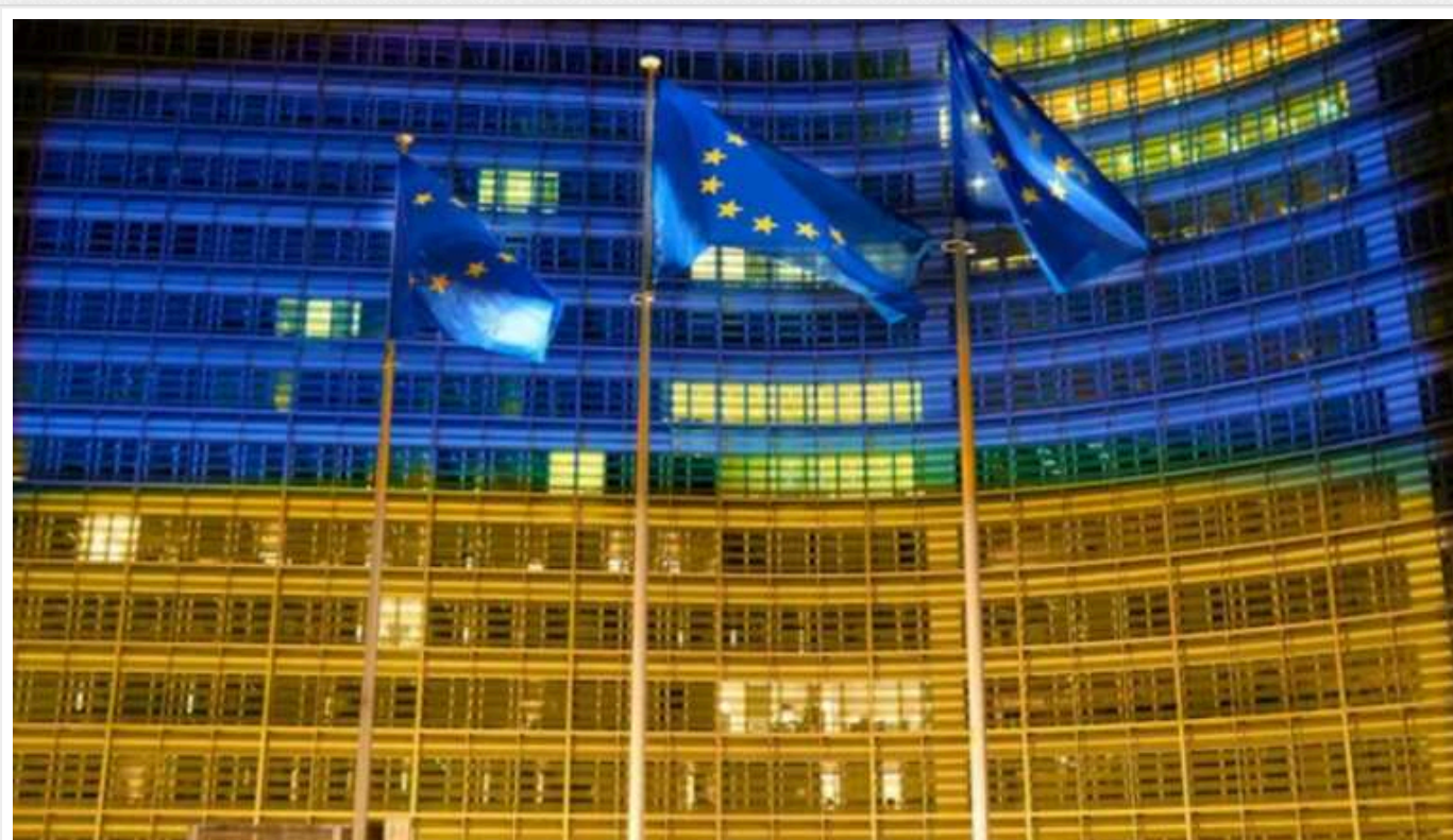
Що містить в собі урядовий план Ukraine Facility, за виконання якого Євросоюз дасть Україні 50 мільярдів євро

Прем'єр-міністр Денис Шмигаль передав президентці Єврокомісії Урсулі фон дер Ляєн затвердженій Кабінетом план Ukraine Facility.