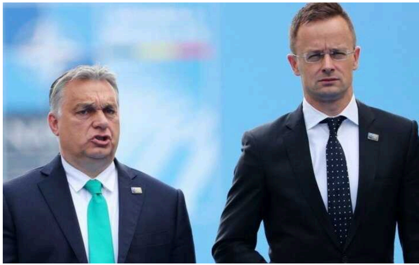
Сіярто захотів співпрацювати з РФ у галузях, де немає санкцій, а Орбан відправив листа Путіну

Угорщина готова відкрито обговорювати з Росією співпрацю у галузях, які не потрапили під санкції Євросоюзу. Втім, це повинно відповідати національним інтересам.