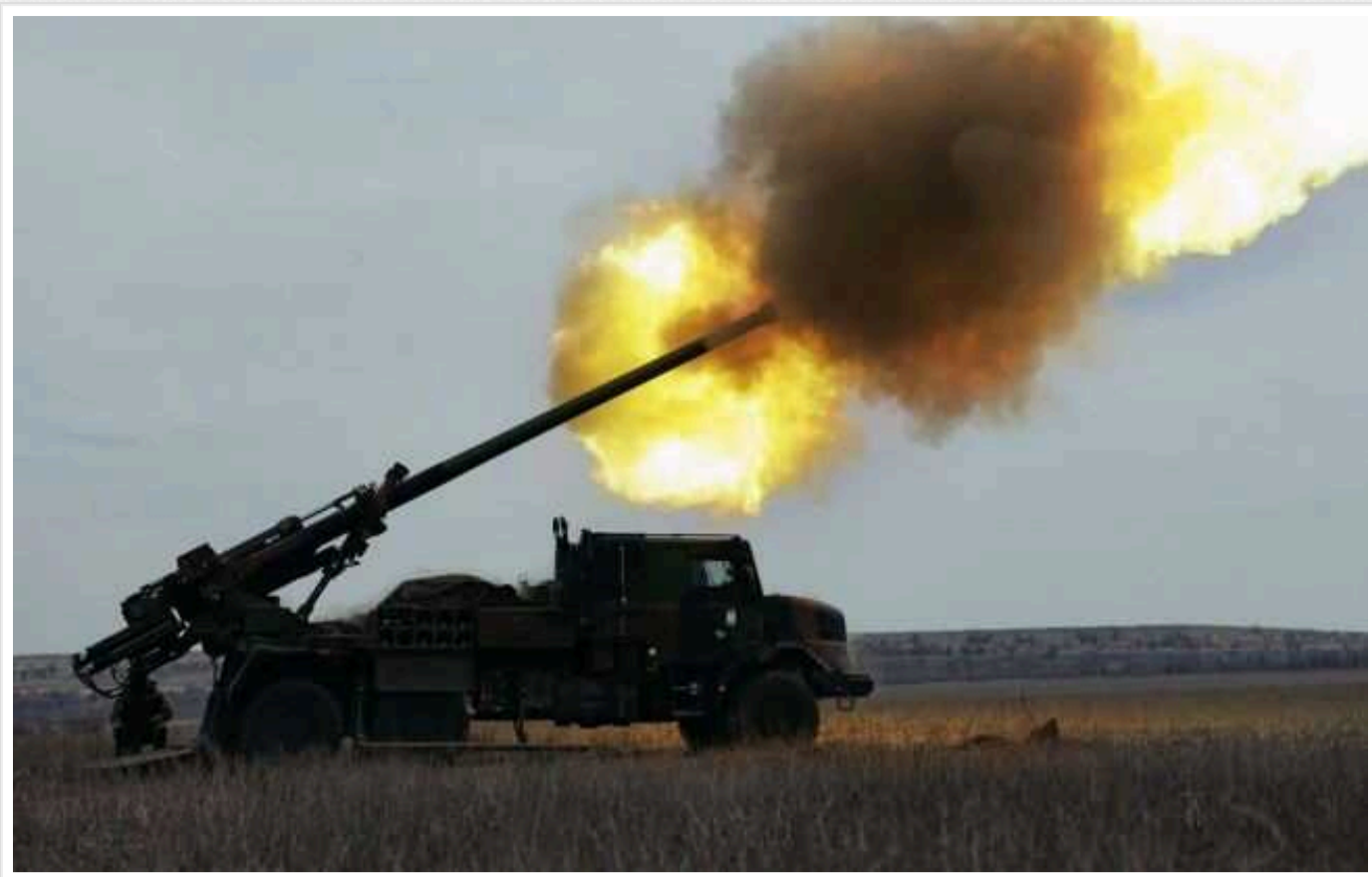
Ситуація на фронті: на Новопавлівському напрямку точаться гарячі бої, авіація Сил оборони завдала 9 ударів по ворогу

Російські окупаційні війська продовжують вчиняти штурмові дії на Новопавлівському напрямку, де точаться гарячі бої. Загалом за добу відбулося 67 прямих бойових зіткнень між путінською армією та українськими захисниками.