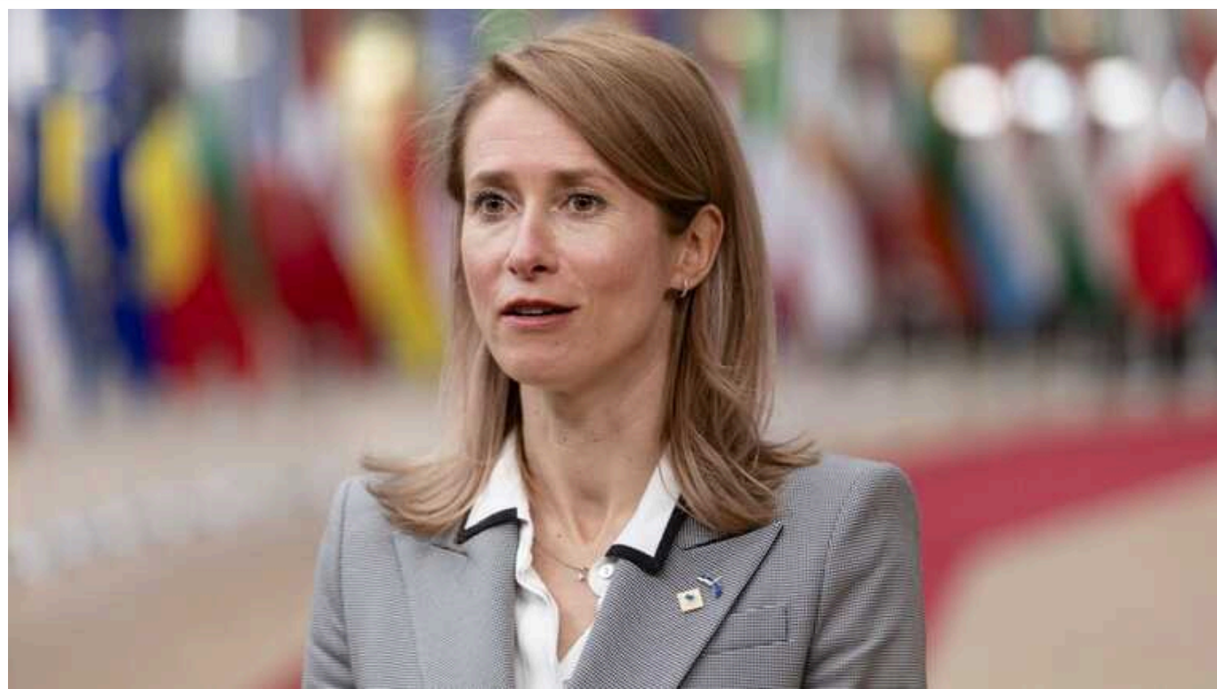
Естонія пропонує єдиний внесок для кожного: чверть відсотка ВВП на допомогу Україні

Кая Каллас наполягає, що кожна із понад 50 країн, які входять до коаліції "Рамштайн", мають виділити 0,25% свого валового внутрішнього продукту на військову допомогу Україні.