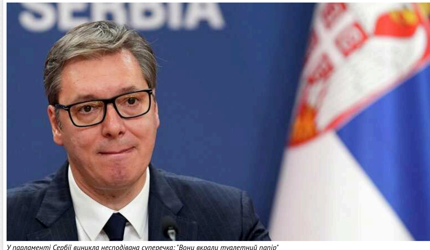
У парламенті Сербії виникла несподівана суперечка: "Вони вкрали туалетний папір"

Президент Олександр Вучич заявив, що опозиціонери вкрали рулони паперу для "атаки" на новопризначеного спікера. У партії у відповідь вказали "найкращому студенту юрфаку" на помилку.