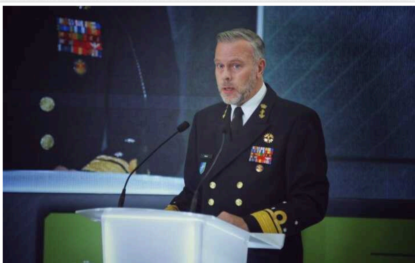
У НАТО відмовилися називати Україну жертвою: "Ви адаптувалися та дали відсіч"

Українці зуміли докорінно змінити багато аспектів сучасної війни, поєднуючи окопи та артилерію у дусі Першої світової війни та безпілотники та штучний інтелект ХХІ століття, зазначив нідерландський адмірал Роб Бауер.