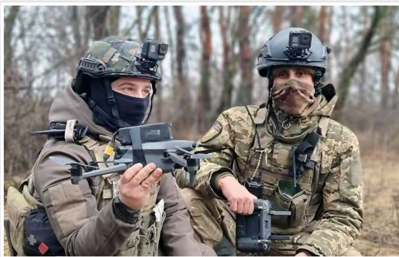
Окупанти поскаржилися на "рій дронів" у районі Авдіївки: "Ішли в рівному строю"

Окупанти вважають, що українські захисники тестують нову технологію, застосовуючи велику кількість безпілотників.