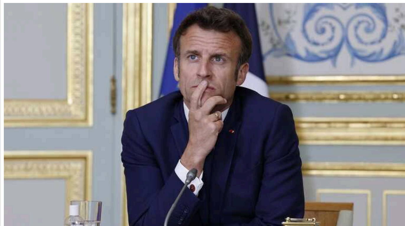
Макрон вважає, що "Україна може впасти дуже швидко", - Politico

Видання Politico пише, що вчора на закритій вечері президент Франції Еммануель Макрон заявив, що "Україна може впасти дуже швидко".