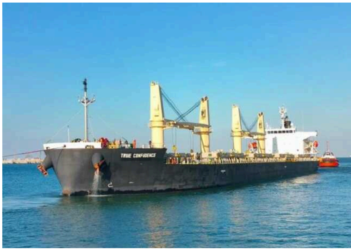
Bloomberg: РФ і Китай домовилися з хуситами про безпечний прохід кораблів у Червоному морі

Видання Bloomberg пише, що Китай і Росія досягли угоди з хуситами про суднопластво Червоним морем.