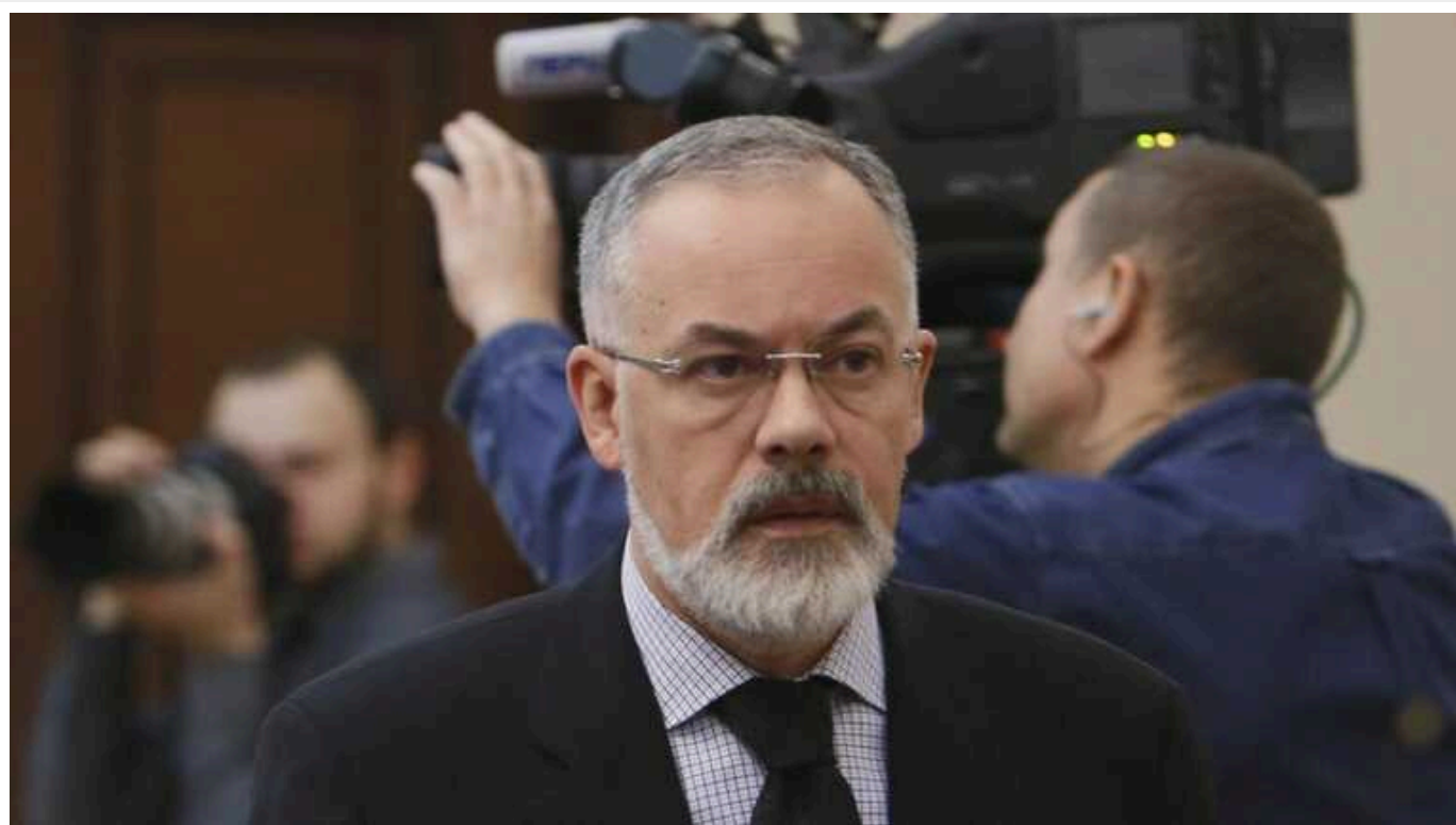
Експіністру освіти Табачнику винесли вирок заочно

Колишній міністр освіти та науки Дмитро Табачник заочно отримав 15 років ув'язнення. Суд також ухвалив вирок ексклаві Державної реєстраційної служби Дмитру Вороні – 12 років заочно.