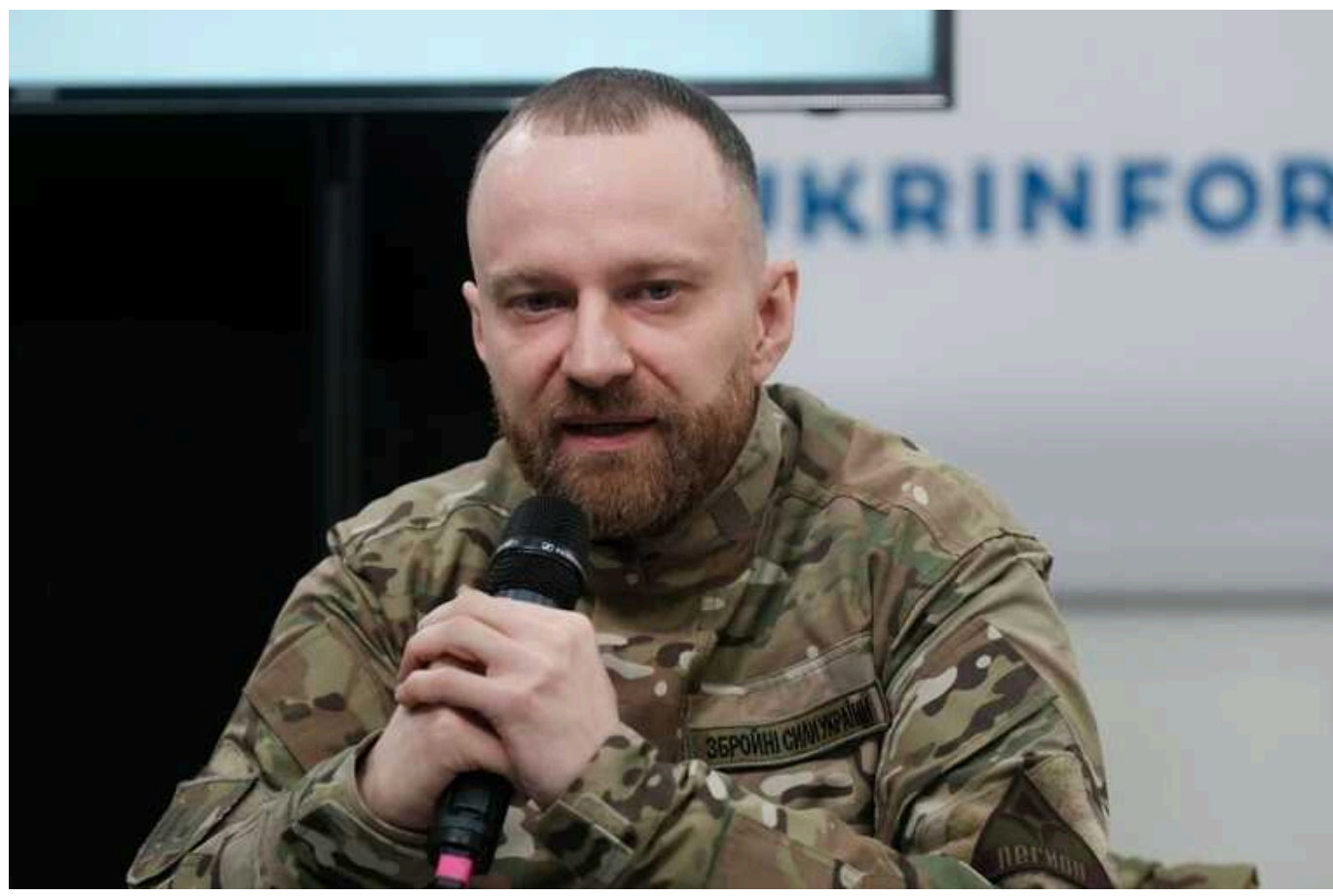
ЛСР заявляє, що їхній рейд у РФ зірвав плани Путіна щодо наступу

Прорив кордону Російської Федерації дозволить зірвати плани армії російського диктатора Володимира Путіна щодо наступу, які були присвячені "перемозі" у виборах президента.