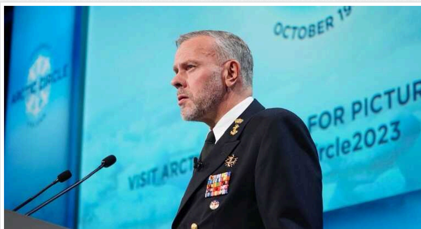
Роб Бауер заявив про необхідність додаткової мобілізації в Україні

Україні потрібна не лише західна зброя, щоб перемогти у війні Російську Федерацію. Армії також потрібні люди – тобто продовження мобілізації.