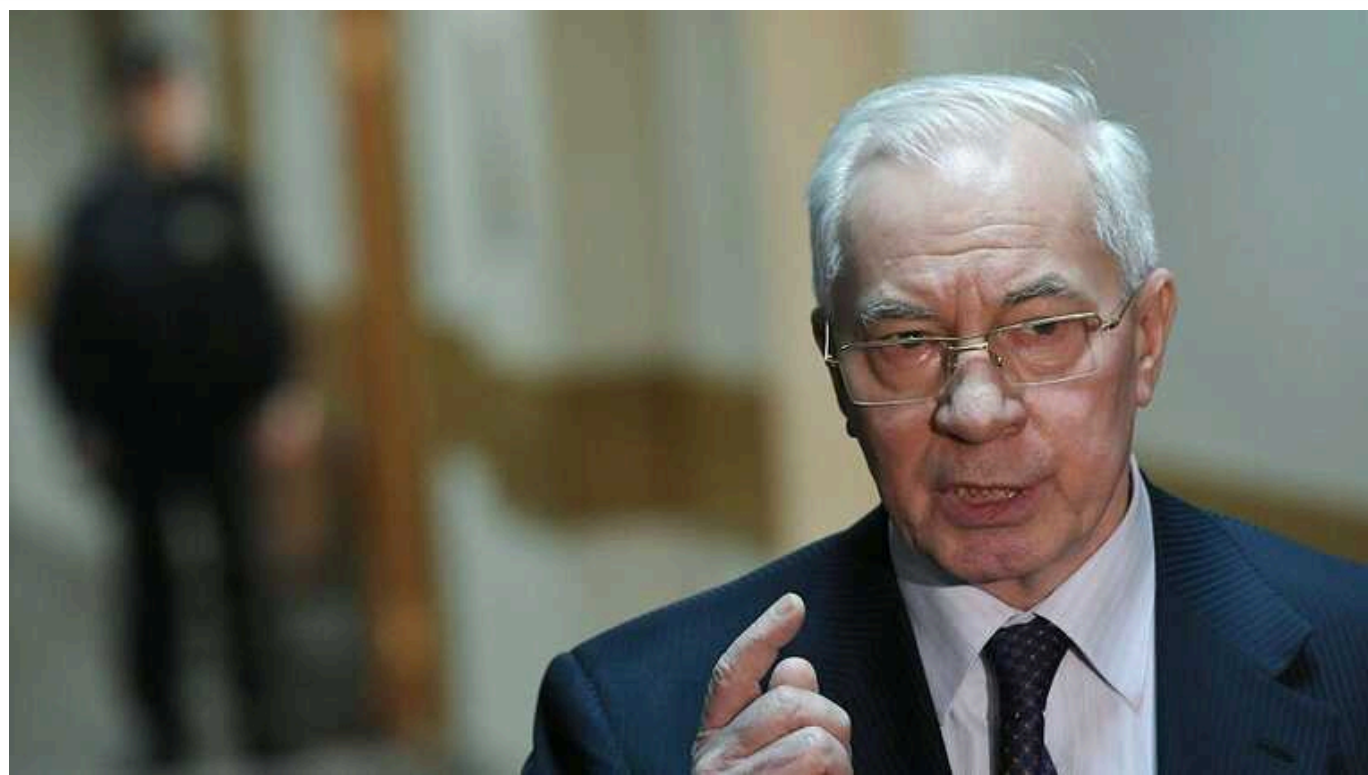
Експрем'єра Азарова судитимуть за держзраду: справу передали до суду

Колишнього прем'єр-міністра України Миколу Азарова, добре відомого в народі, як "кровосіс", заочно судитимуть за державну зраду та антиукраїнські меседжі у соцмережі Telegram. Прокурори вже скерували до суду обвинувальний акт щодо нього та його помічниці, яка втекла до Росії.