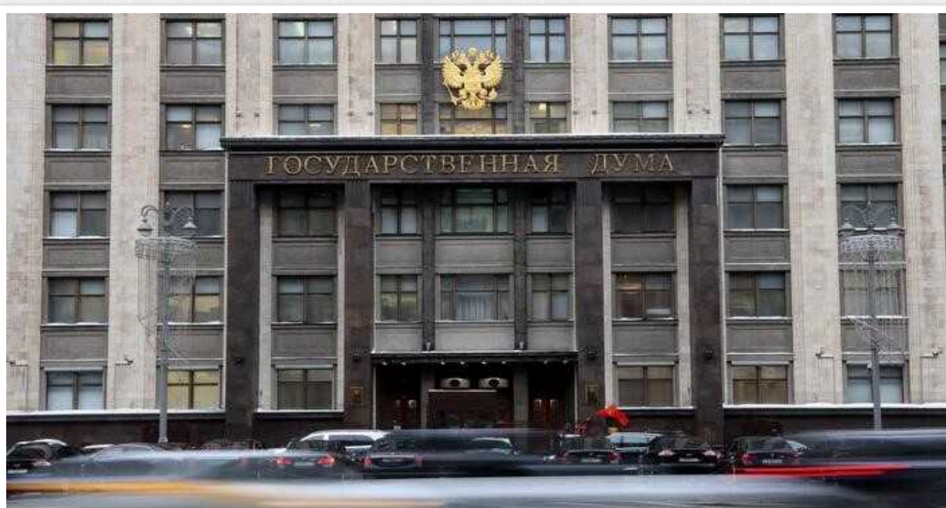
У Держдумі РФ пригрозили вбити всіх французьких військових, які прибудуть в Україну

Віцепікер Державної думи РФ Петро Толстой пригрозив французьким військовим вбивством у разі їхнього прибуття на територію України. Також представник країни-терориста РФ видав, що йому начхати на думку президента Франції Еммануеля Макрона.