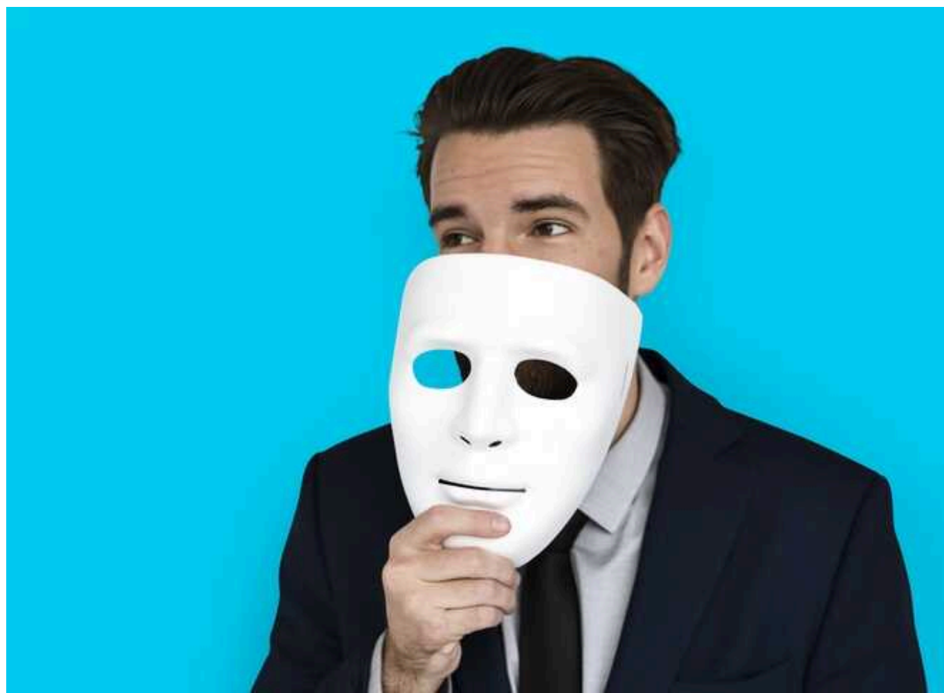
Як за кілька секунд визначити, що людина бреше: спеціаліст з мови тіла, назвав "червоні прапорці"

Іноді важко розпізнати брехню за манерою спілкування, тому у цьому випадку допоможуть знання фізіологічних процесів, які відбуваються із людиною, коли вона не бере. Такі мімічні зміни, як часте моргання, активний рух очей, важке ковтання та почервоніння шкіри враз вказують, що не все насправді так, як вам про це розповідають.