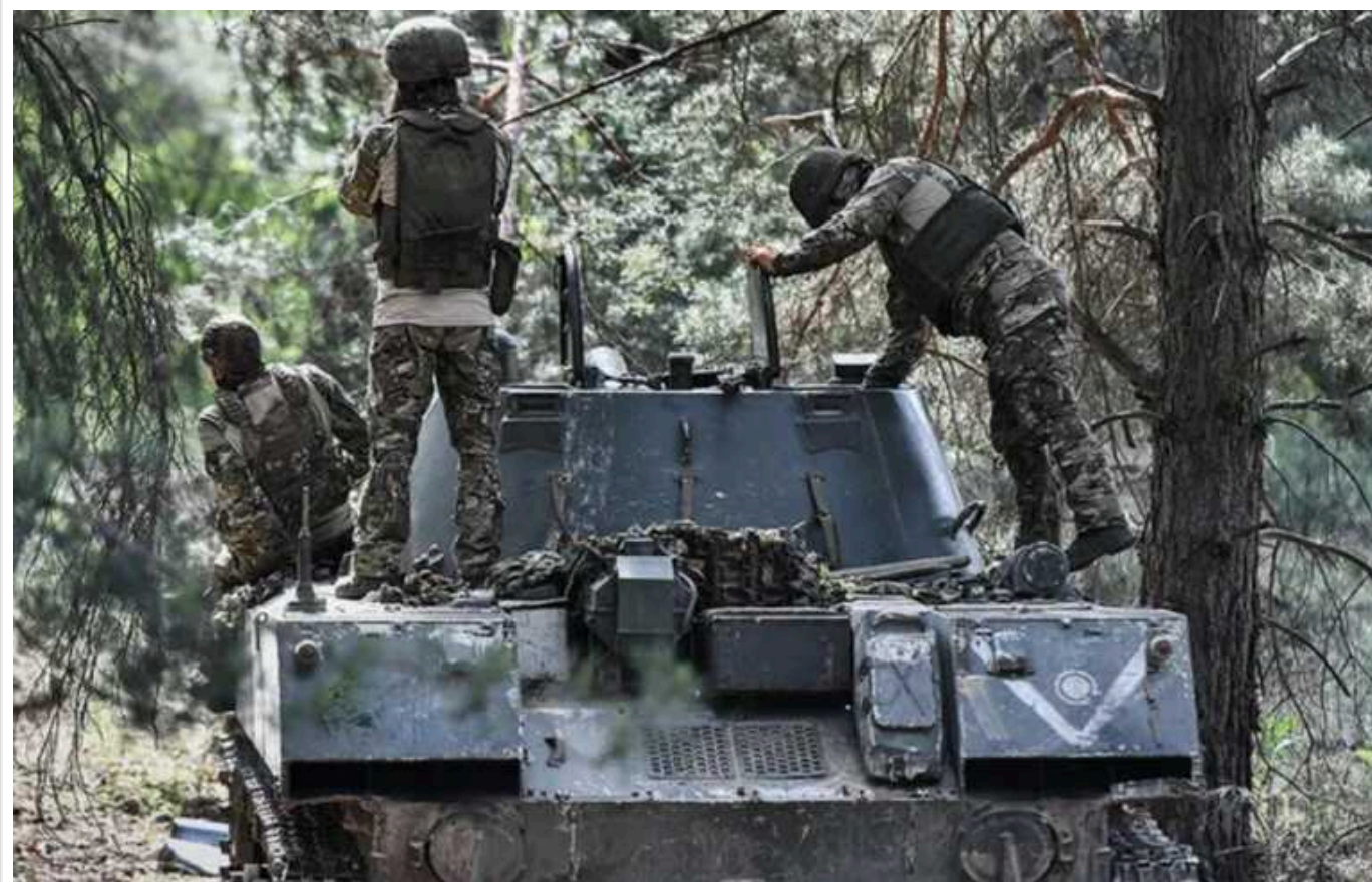
Британська розвідка пояснила, чому наступ військ Путіна в Україні сповільнився

Темпи наступу окупаційних військ Російської Федерації в Україні в останні тижні знизилися. Частково це пояснюється значними втратами ворога в районі Авдіївки Донецької області.