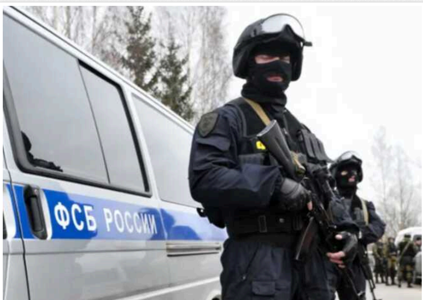
В ISW пояснили, що стоїть за заявами Путіна про "особливу" роль ФСБ

Після "виграшу" на президентських виборах у Росії, диктатор Володимир Путін висунув Федеральну службу безпеки (ФСБ) РФ як ключового гаранта безпеки та суверенітету країни. Очевидно, що Путін буде покладатися на підтримку цієї структури під час свого п'ятого президентського терміну.