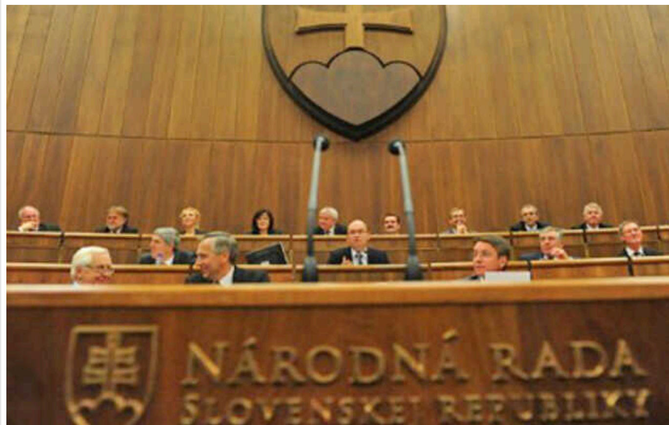
Politico: У Словаччині ліквідували антикорупційну прокуратуру, що викликало обурення ЄС

Рішення ухвалив парламент з подачі прем'єра Фіцо.