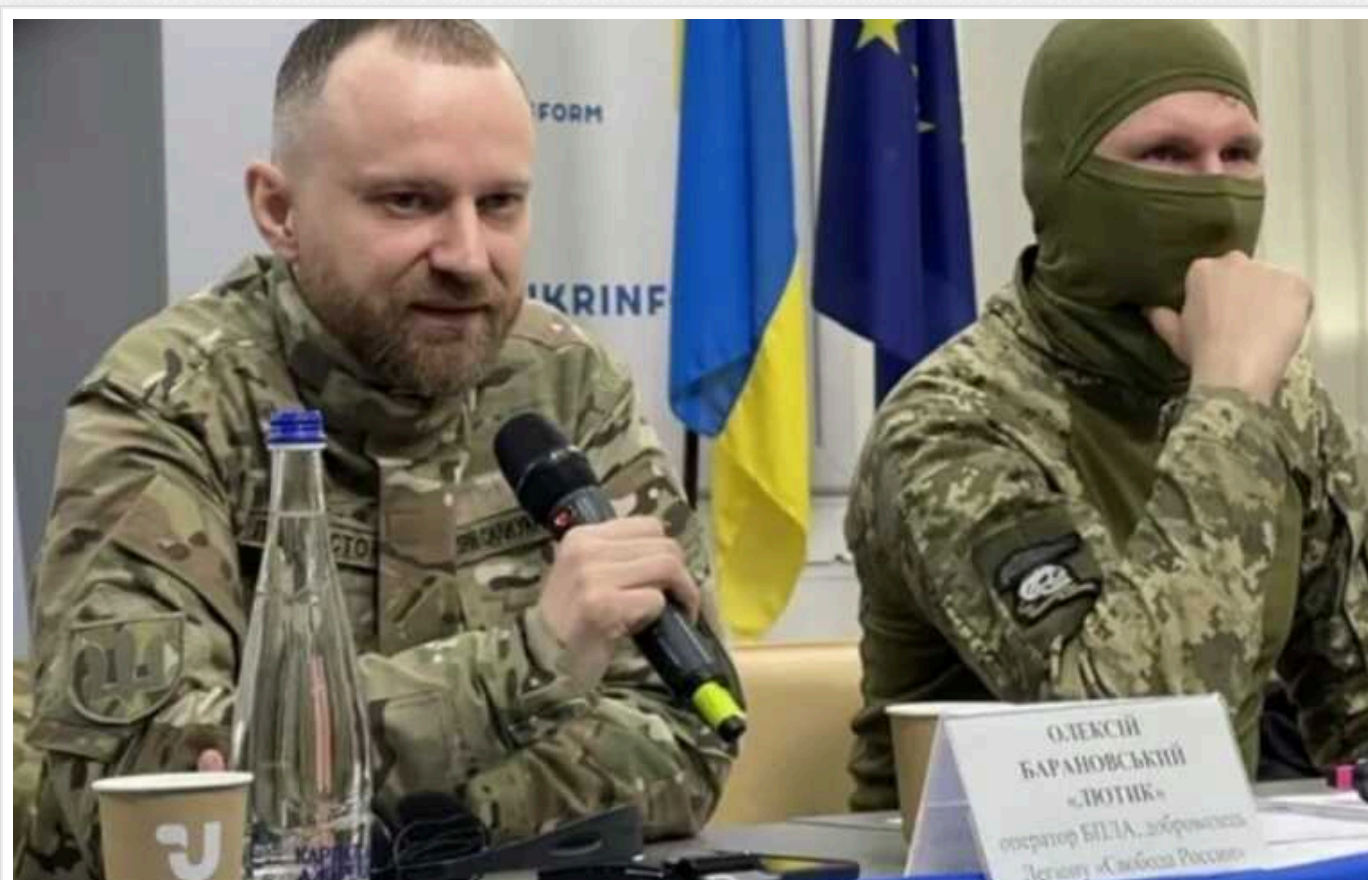
У РДК розкрили дані про результати свого рейду: втрати армії Путіна досягли 1500 осіб

Більш як за тиждень бойових дій у Белгородській області російська окупаційна армія втратила понад 1500 осіб. Безповоротні втрати країни-терориста РФ становлять 651 особу, а санітарні – 980.