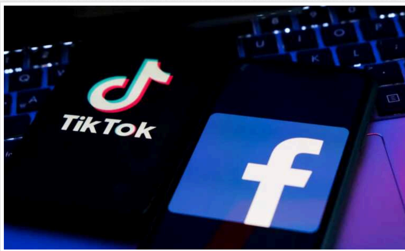
Євросоюз зобов'яже платформи X, Facebook та TikTok вжити заходів у зв'язку з євровиборами

Євросоюз планує наказати соцмережам X, TikTok, Facebook та іншим великим онлайн-платформам вжити заходів для зменшення ризиків для виборів до Європарламенту, інакше ті зіткнуться зі штрафами.