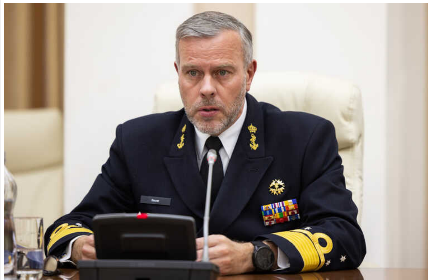
До Києва прибув голова Військового комітету НАТО Роб Бауер

Бауер виступив на Київському безпековому форумі, подякувавши за можливість особисто відвідати Україну та зустрітись з українським політичним і військовим керівництвом.