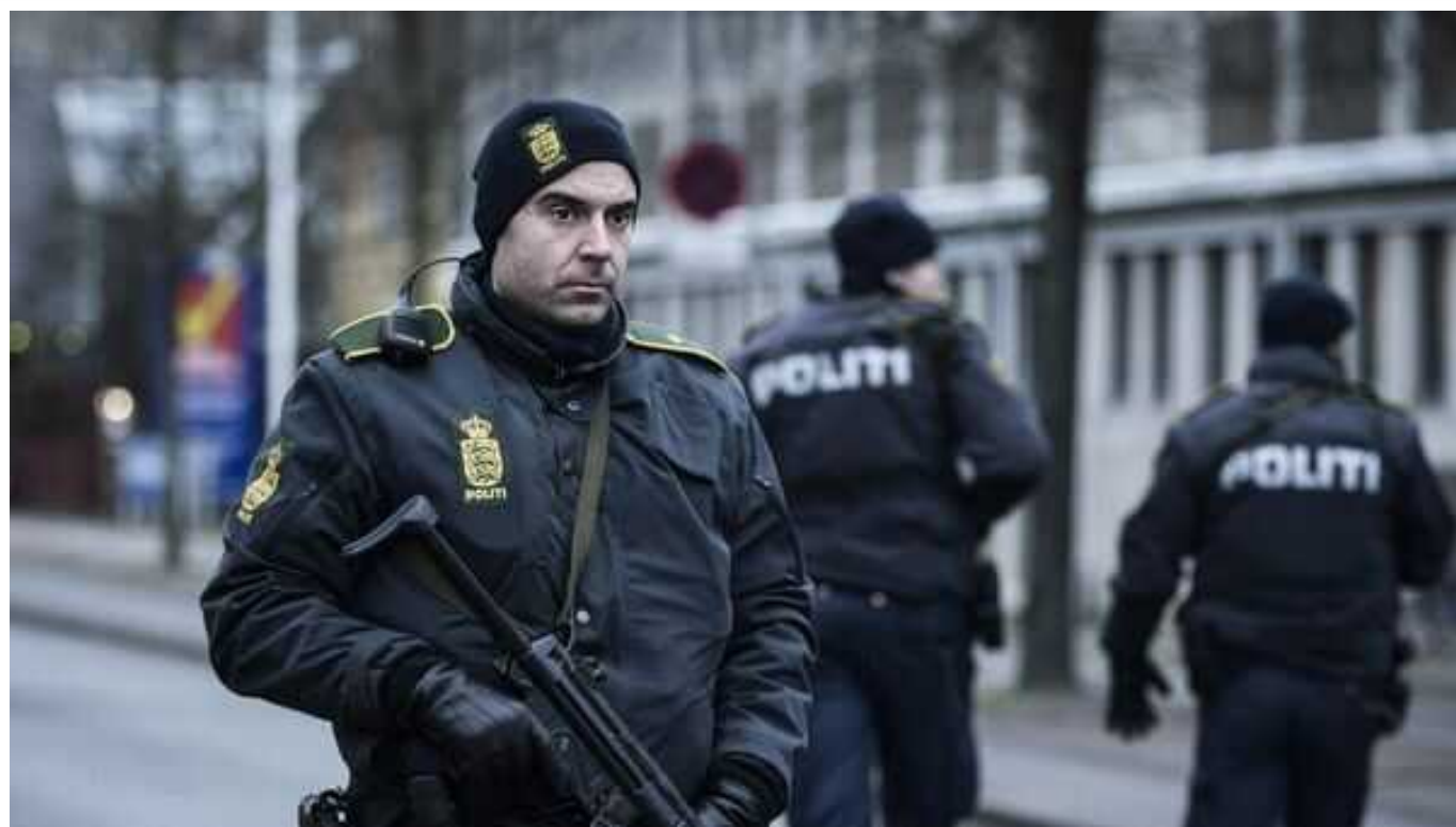
У Данії спецслужби попередили про зростання терористичної загрози

Спецслужби Данії вважають, що рівень терористичної загрози для Данії підвищився у зв'язку з акціями зі спаленням Корану, що відбулися минулого року.