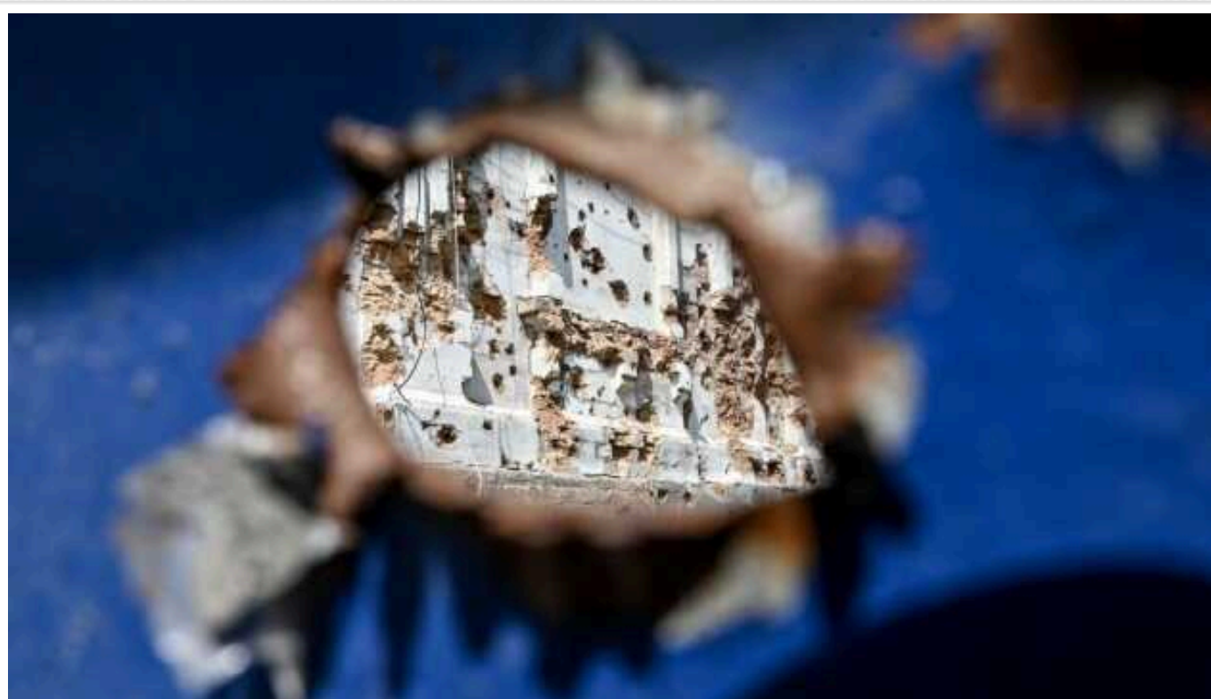
Окупанти минулої доби вбили двох жителів Донецчини

За минулу добу, 20 березня, російські війська вбили двох жителів Донецької області та ще двом завдали поранень.