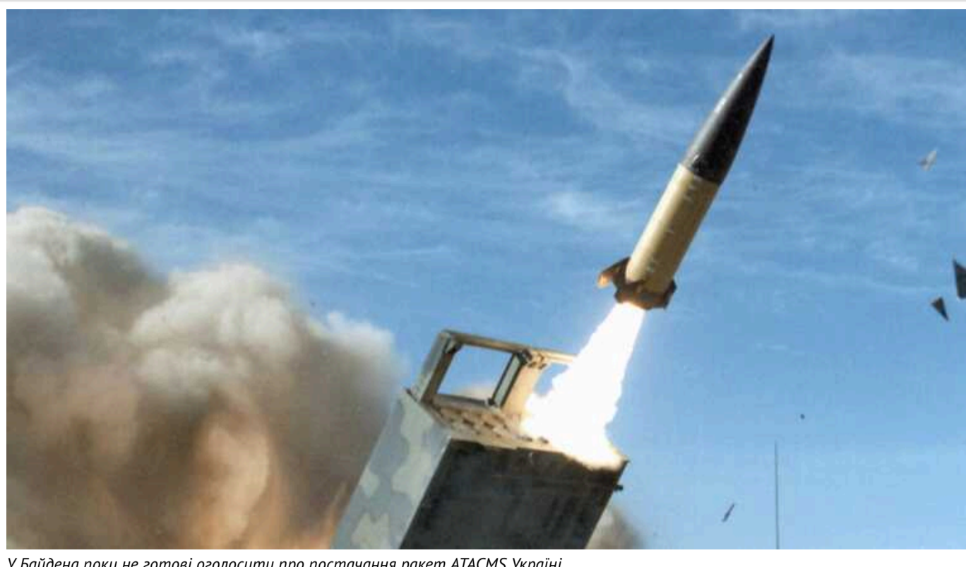
У Байдена поки не готові оголосити про постачання ракет АТАСМС Україні

Про це у Києві заявив радник Байдена з нацбезпеки Джейк Салліван.