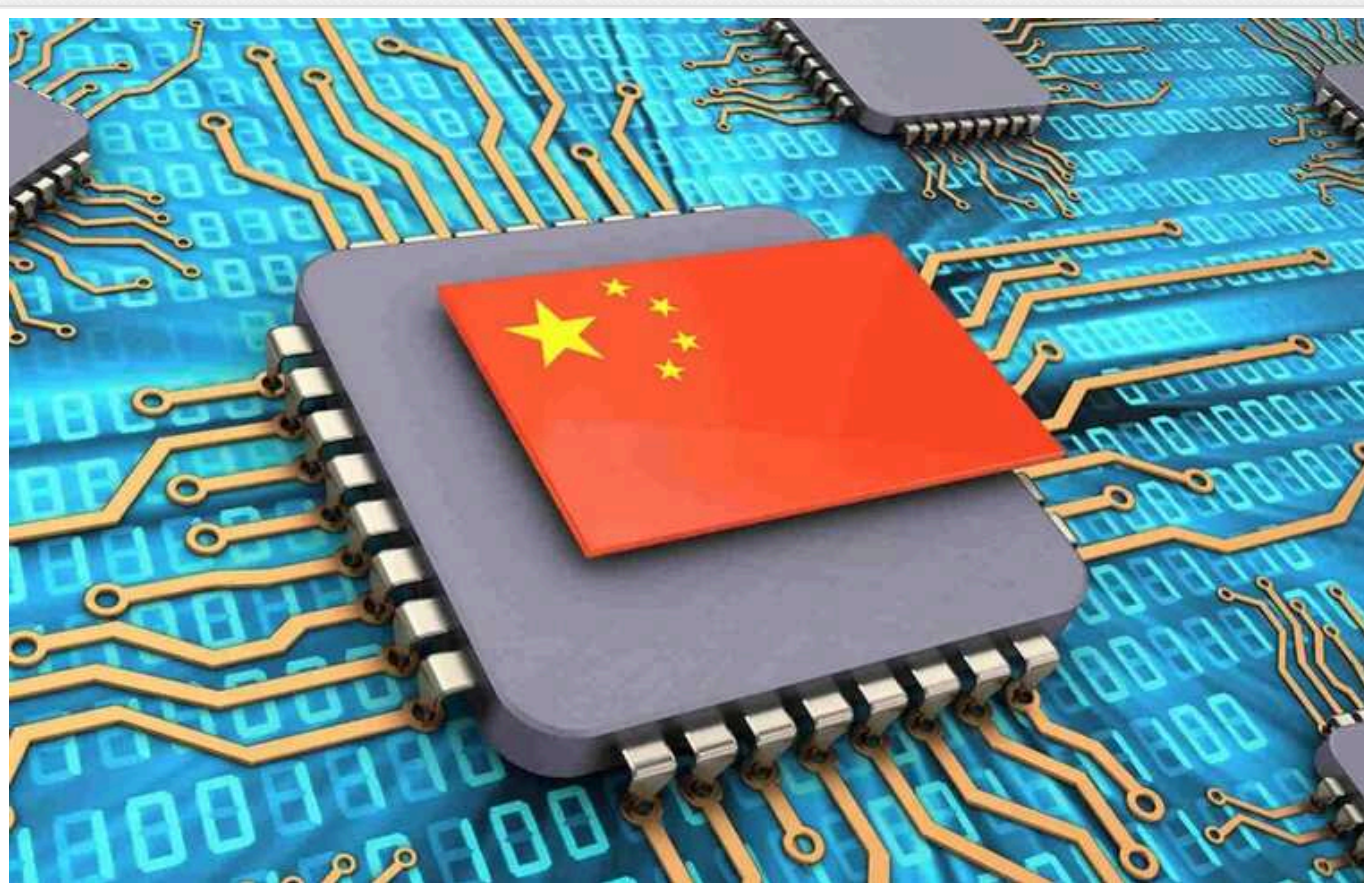
КНР втратить можливість завозити чипи в обхід санкцій США

США не сподобалося те, що Huawei продовжує виробляти передові чипи, незважаючи на санкції. Компанію запідозрили в організації секретної мережі поставок.