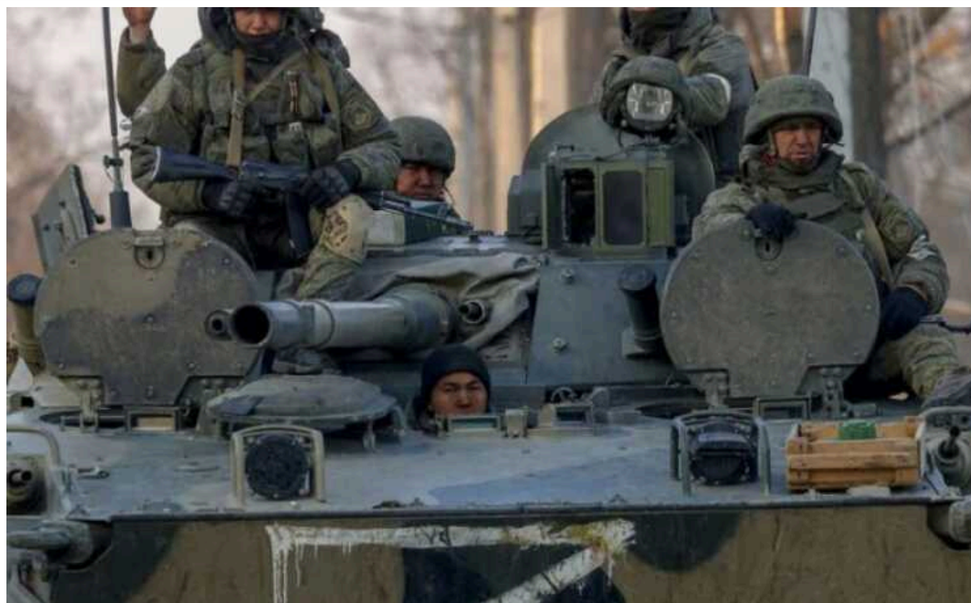
Bloomberg: РФ перекидає військових з фронту в Україні до Белгородської області

Бойові дії у регіонах, що межують з Україною, збільшують витрати Російської Федерації на повномасштабне вторгнення, розповіли журналісти.