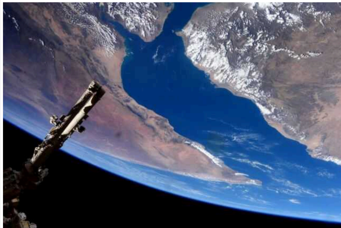
Міноборони України хоче обмежити супутникову зйомку над Україною

РФ використовує супутникові дані для завадання ударів по Україні. Необхідно протидіяти ворожій космічній розвідці.