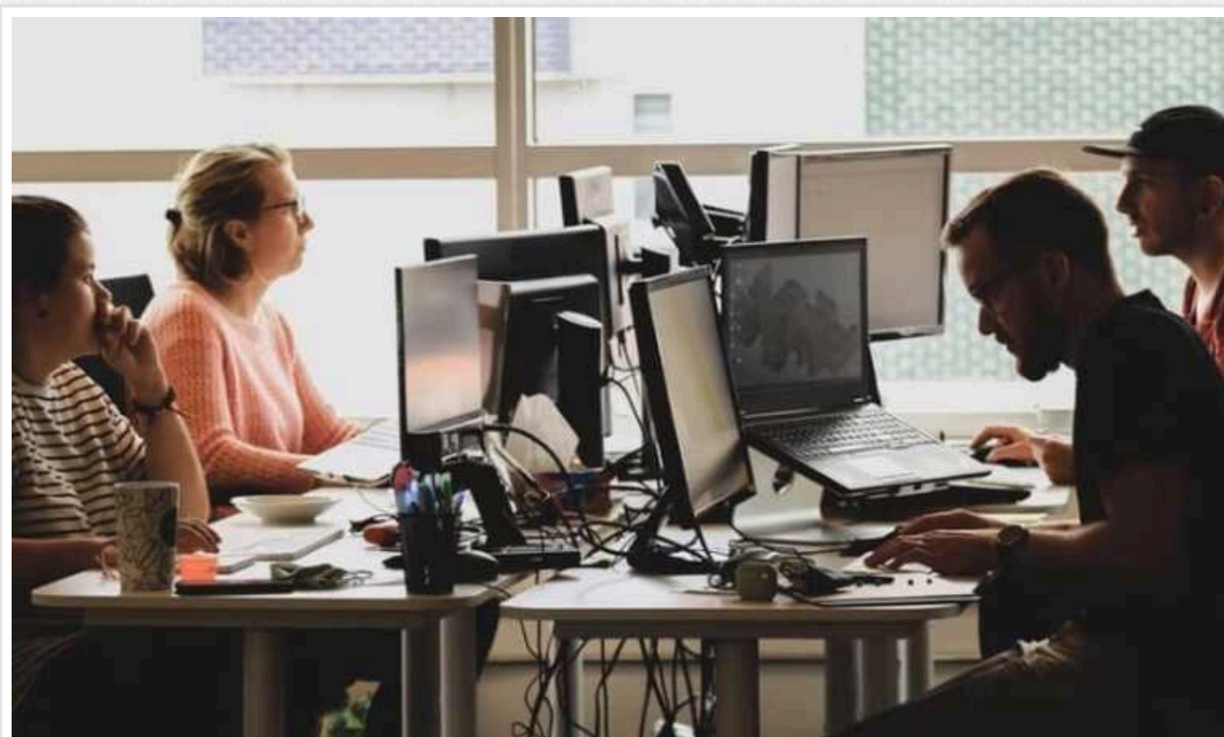
У Литві через кібератаки не працювали сайти президента, прем'єра та частини міністерств

У Литві, у роботі сайтів президента, прем'єра та деяких міністерств сталися збої.