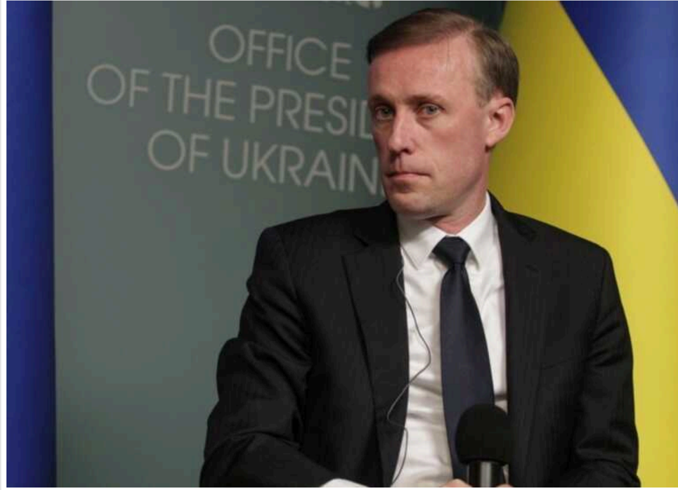
Салліван пояснив, що для України буде перемогою у війні

Для України перемогою у війні з Росією буде вийти з неї суверенною, незалежною, вільною країною, здатною стримувати майбутню агресію.