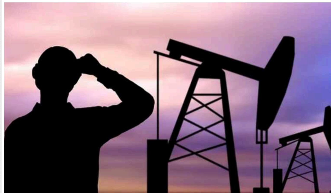
Reuters: Індійський НПЗ відмовився приймати російську нафту

Індійська компанія Reliance Industries не купуватиме російську нафту, завантажену на танкери "Совкомфлота", після нещодавніх санкцій США.