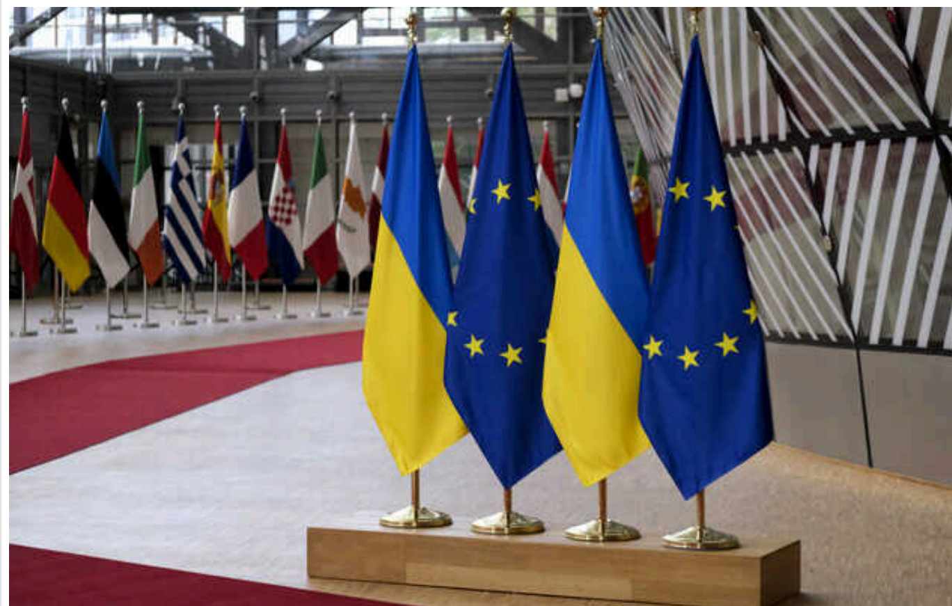
На саміті ЄС 21-22 березня не буде ухвалено рішення щодо доходів від російських активів, – DW

За словами джерела із дипломатичних кіл, серед більшості країн-членів ЄС є спільне розуміння того, що кошти мають піти на купівлю зброї та боеприпасів для ЗСУ.