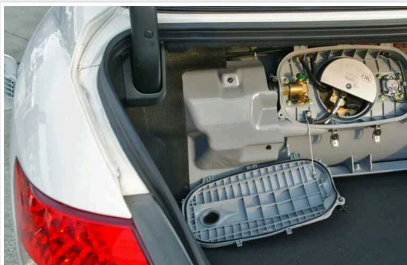
Українцям пояснили, як перереєструвати автомобіль після встановлення ГБО

Власники автомобілів, які хочуть економити на паливі за допомогою ГБО (газобалонного обладнання), обов'язково мають перереєструвати авто в територіальному сервісному центрі Міністерства внутрішніх справ (МВС). Зробити це можна протягом 10 днів після встановлення ГБО, причому навіть не привозячи автомобіль із собою. Якщо порушити вимогу, доведеться заплатити штраф, а при повторному порушенні можна втратити право на керування автомобілем.