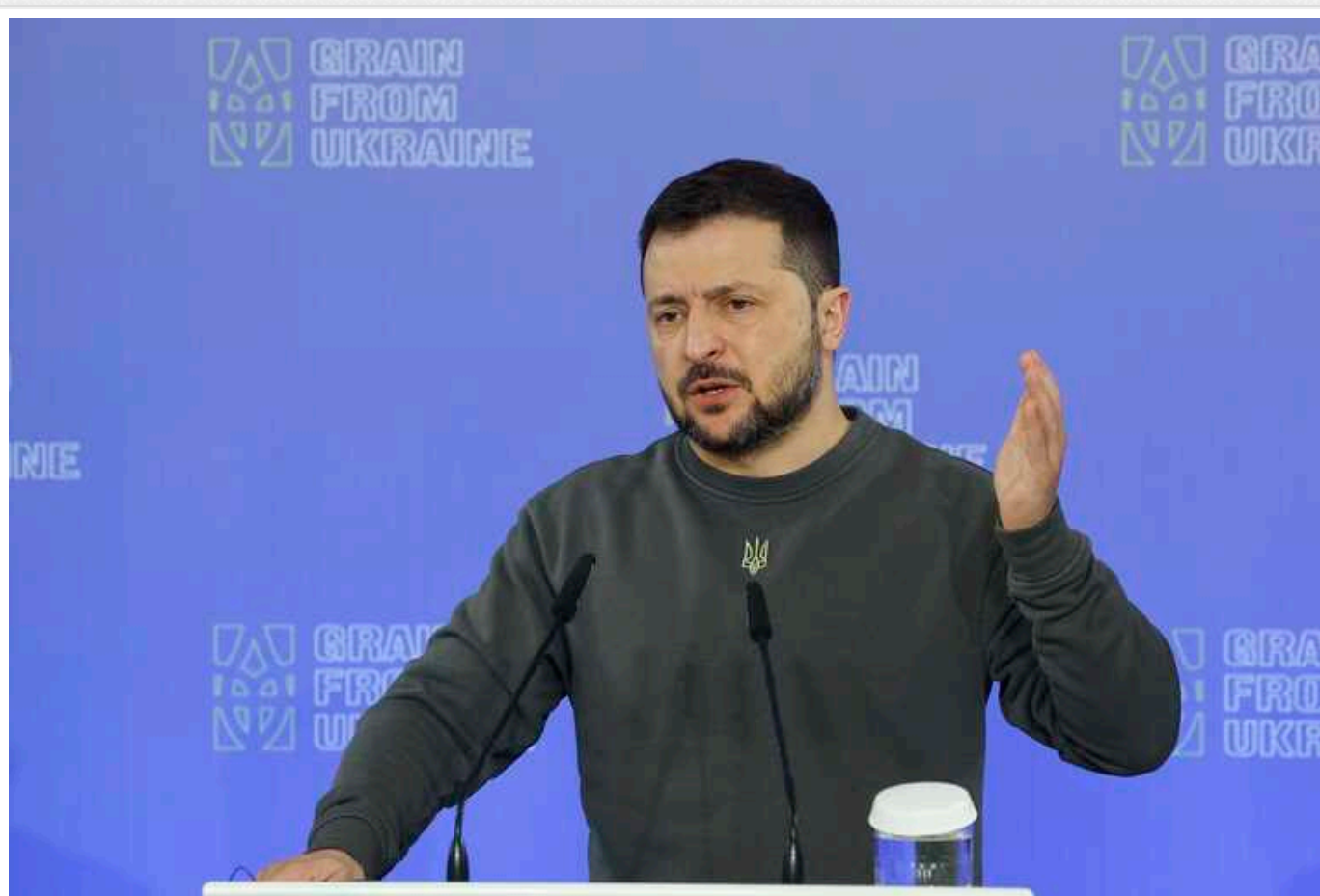
Зеленський звернувся до учасників третього Саміту за демократію

Ми зневажаємо колонізаторський погляд на світ. Саме він розподіляє нації між так званими великими державами чи геополітичними полосами.