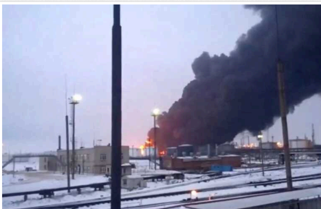
Bloomberg: Удари українських БПЛА по російських НПЗ означають новий етап війни на виснаження

З початку 2024 року на території Росії було атаковано щонайменше дев'ять великих нафтопереробних заводів. Ударів було завдано за допомогою БПЛА, і вони означають, що Україна розпочала новий етап у війні, яку проти неї вже два роки веде агресор.