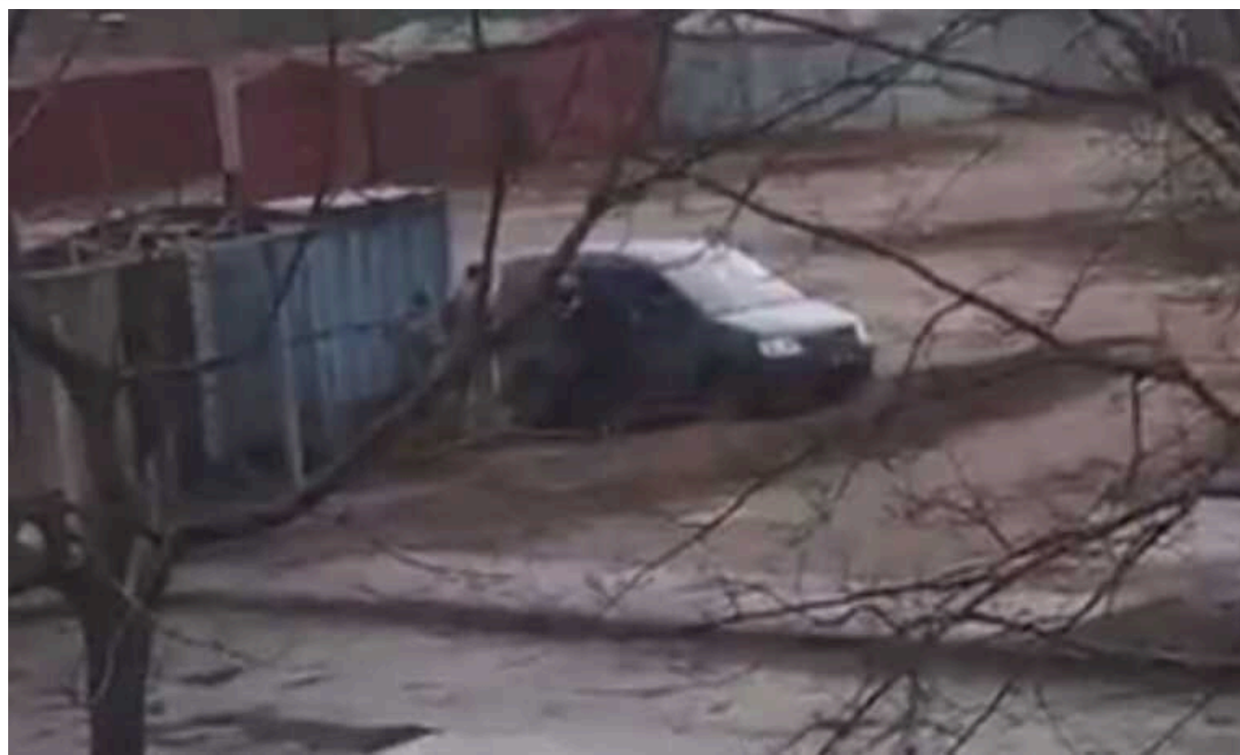
У Шостці Сумської області співробітники ТЦК побили цивільного

Сумський обласний ТЦК визнав факт конфлікту та пообіцяв «дати оцінку» діям військових.