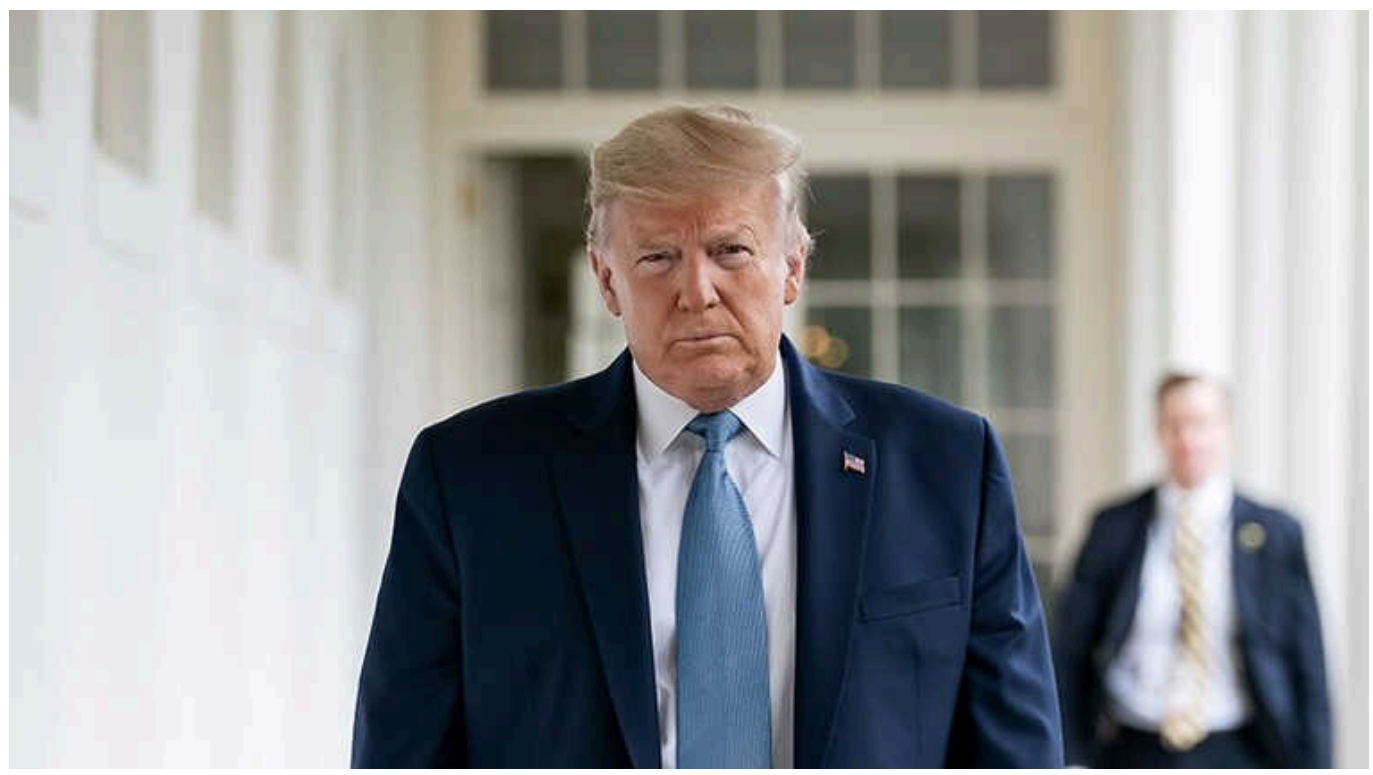
Ілля Пономарьов пояснив, у якому випадку Трамп надасть Україні більше допомоги, ніж адміністрація Байдена

Російський опозиціонер Ілля Пономарьов в інтерв'ю Radio NV пояснив, у якому випадку Дональд Трамп, який знову претендує на пост президента США, надасть Україні більше допомоги, ніж адміністрація Джо Байдена.