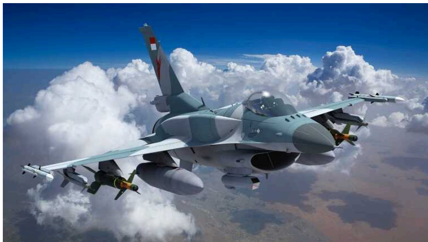
У Пентагоні назвали "червоні лінії" для України у використанні F-16

Винищувачі F-16 дадуть "унікальний повітряний потенціал" Україні. Водночас використовувати їх можна буде лише в межах суверенної території.