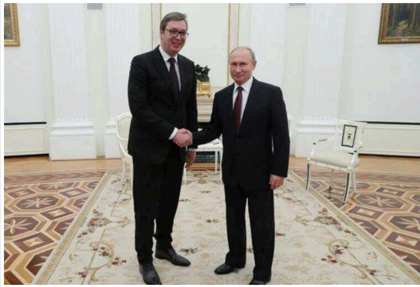
На Балканах може спалахнути нова війна, – The Wall Street Journal