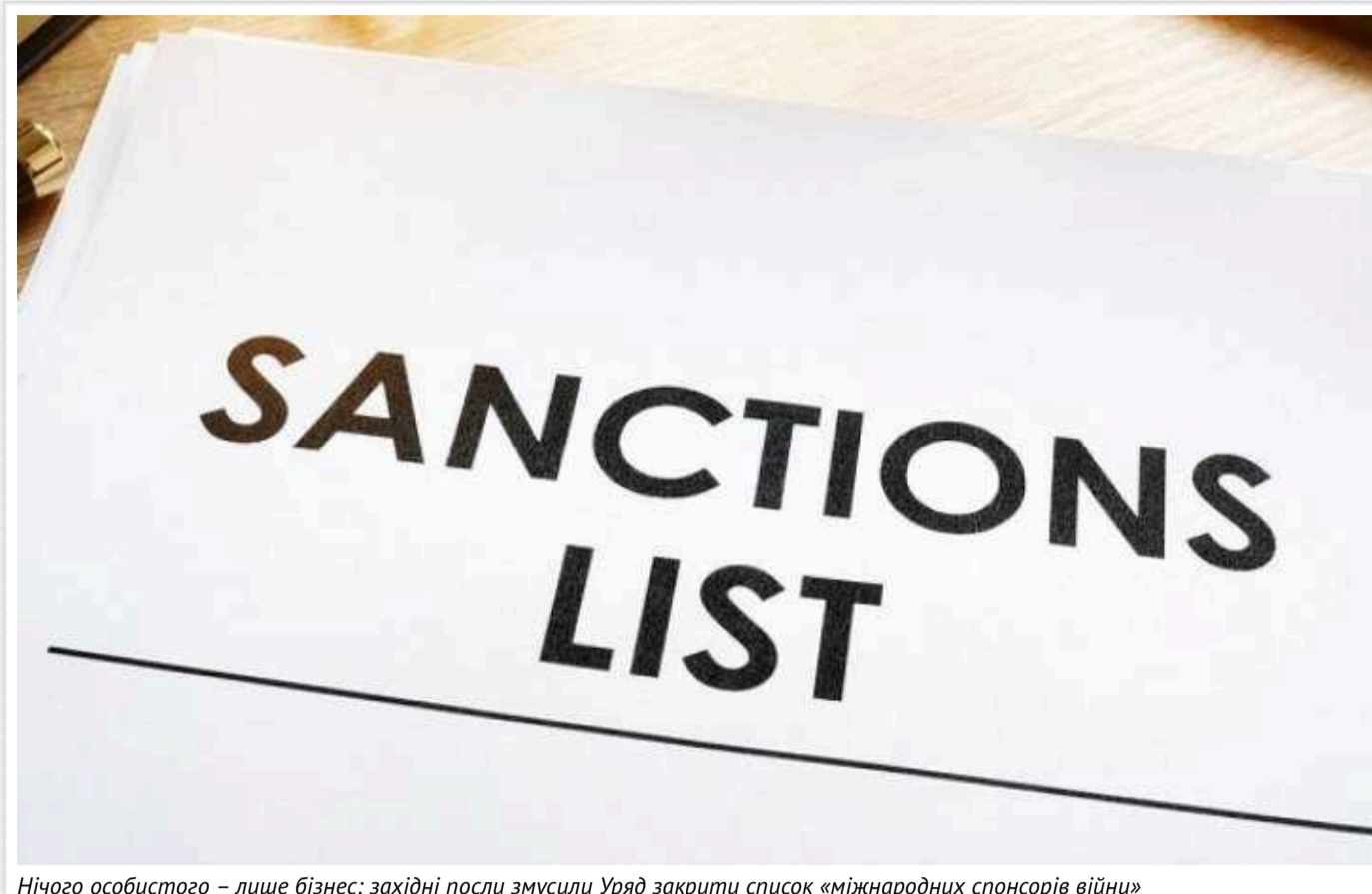
Нічого особистого – лише бізнес: західні посли змусили Уряд закрити список «міжнародних спонсорів війни»

Західні посли змусили український Уряд закрити список «міжнародних спонсорів війни», щоб західні компанії могли продовжувати працювати в Росії, не несучи репутаційних ризиків.