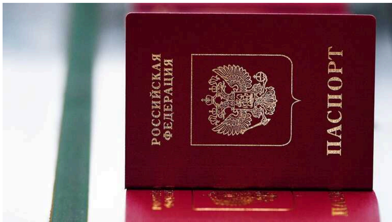
Франція вперше надала притулок росіянину, який втік від мобілізації в РФ

Французький Національний суд (Cour nationale du droit d'asile; CNDA) вперше погодився надати притулок росіянину, який втік з РФ коли отримав повістку на мобілізацію. Громадянин Росії, ім'я якого не розкривається, звернувся до суду після того, як отримав відмову від Французького відомства із захисту біженців та осіб без громадянства (Office Français Protection des Refugies et Apatrides; OFPRA).