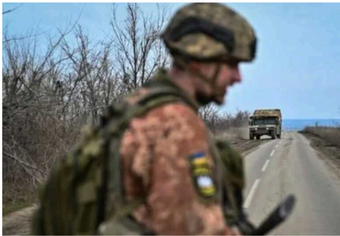
NYT опублікував репортаж із Роботино на Мелітопольському напрямку

Військові аналітики охарактеризували стратегію України зараз як «тримати, будувати та завдавати ударів» по російських тилах.