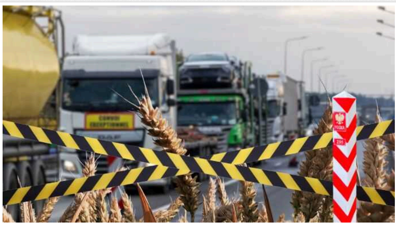
У ВР назвали суму, яку Україна втратила через блокаду українсько-польського кордону

6,5 млрд гривень втратить у березні український бюджет через польську блокаду, повідомив голова фінансового комітету парламенту Гетьманцев. У лютому бюджетні втрати становили 7 млрд гривень.