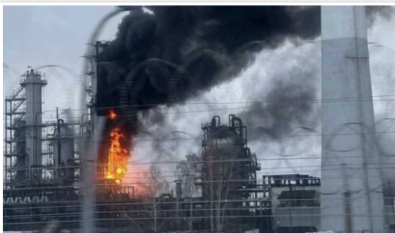
Як швидко Росія захиститься від безпілотників ЗСУ, – Defense Express

Захист нафтопереробних заводів від атак із повітря росіяни зможуть налагодити протягом місяця, пояснили аналітики. Після цього українські дрони обернуть інші, не менш важливі цілі.