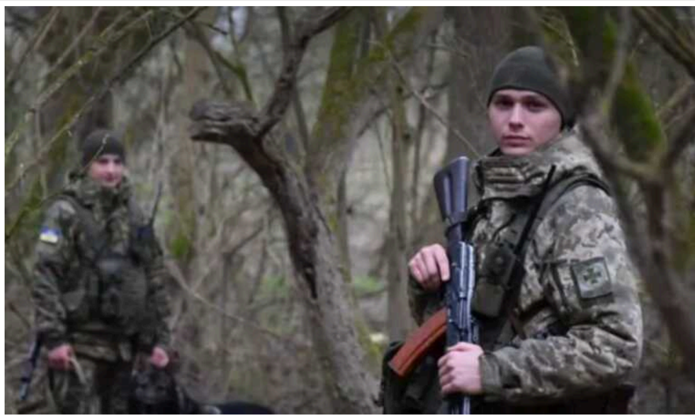
Україна не може на півночі укріпити кордон із РФ, - ДПСУ