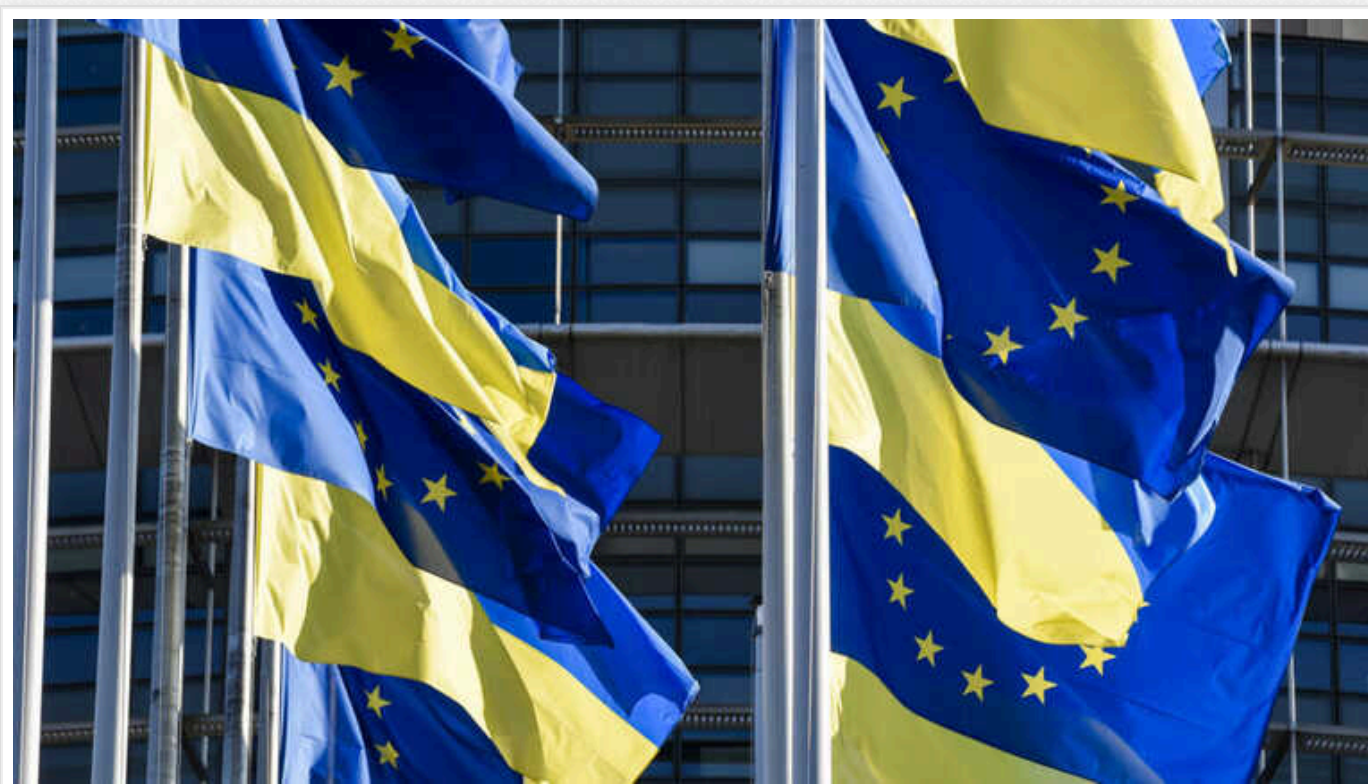
ЄС буде важко виділити Україні ще 50 мільярдів євро замість допомоги США, – Боррель

На цьому наголосив головний європейський дипломат Жозеп Боррель в інтерв'ю Sud-Ouest.