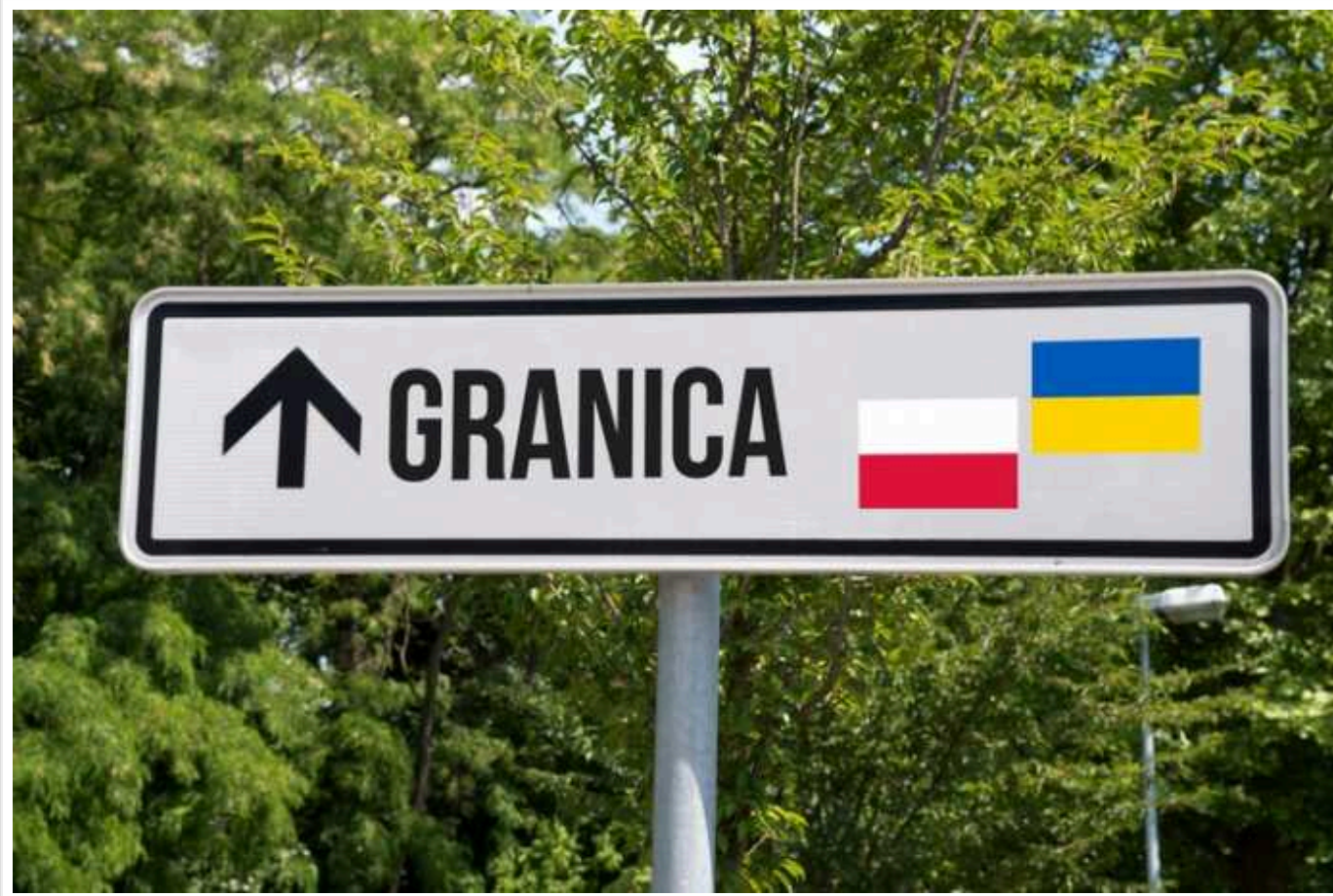
Українсько-польський кордон має бути розблокований, – Боррель

Про це у Брюсселі під час прес-конференції за підсумками Ради асоціації ЄС-Україна заявив представник ЄС Жозеп Боррель.