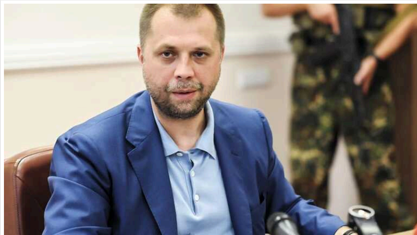
Помічника ексглави "ДНР" посадили на "підвал"

Помічника творця «ДНР» та депутата Держдуми Бородая посадили на підвал в окупованому Луганську.